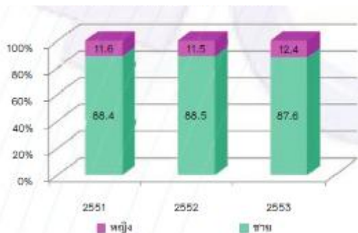
แผนภูมิ 2 ร้อยละของสมาชิกองค์การบริหารส่วนจังหวัด จำแนกตามเพศ