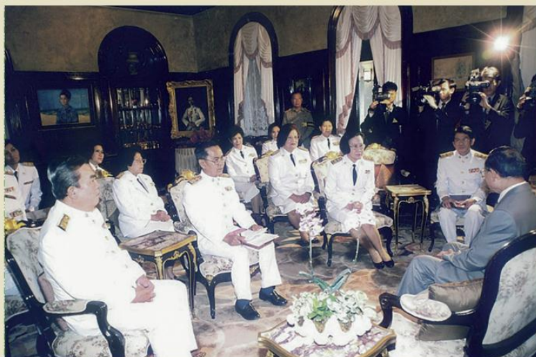
สำมะโนประชากรและเคหะ พ.ศ. 2543 คณะผู้บริหารเฝ้าทูลละอองธุลีพระบาทขอพระราชทานสัมภาษณ์ เมื่อวันที่ 19 เมษายน พ.ศ. 2543 ณ พระตำหนักเปี่ยมสุข วังไกลกังวลหัวหิน จังหวัดประจวบคีรีขันธ์