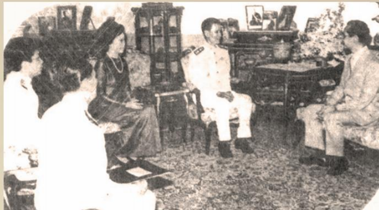
สำมะโนประชากรและเคหะ พ.ศ. 2523 คณะผู้บริหารเฝ้าทูลละอองธุลีพระบาทขอพระราชทานสัมภาษณ์ เมื่อวันที่ 14 เมษายน พ.ศ. 2523 ณ พระตำหนักจิตรลดารโหฐาน พระราชวังดุสิต