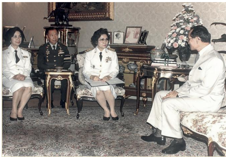
สำมะโนประชากรและเคหะ พ.ศ.๒๕๓๓ คณะผู้บริหารเข้าทูลละอองธุลีพระบาทขอพระราชทานสัมภาษณ์ เมื่อวันที่ ๒๐ มีนาคม พ.ศ. ๒๕๓๓ ณ พระตำหนักจิตรลดารโหฐาน พระราชวังดุสิต