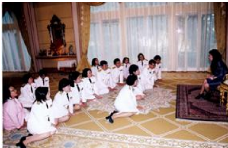
สำมะโนประชากรและเคหะ พ.ศ. ๒๕๕๓ : ๑๐๐ ปี สำมะโนประชากรประเทศไทยเทิดไท้องค์ราชัน คณะผู้บริหารเข้าเฝ้ากราบทูลรายงาน เมื่อวันที่ ๒๖ พฤศจิกายน พ.ศ. ๒๕๕๓ ณ พระตำหนักจักรีบกช จังหวัดปทุมธานี