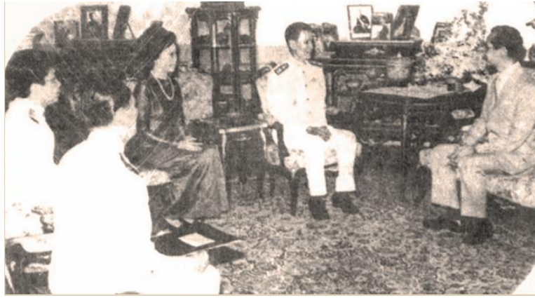
สำมะโนประชากรและเคหะ พ.ศ.๒๕๒๓ คณะผู้บริหารเข้าทูลละอองธุลีพระบาทขอพระราชทานสัมภาษณ์ เมื่อวันที่ ๑๔ เมษายน พ.ศ. ๒๕๒๓ ณ พระตำหนักจิตรลดารโหฐาน พระราชวังดุสิต