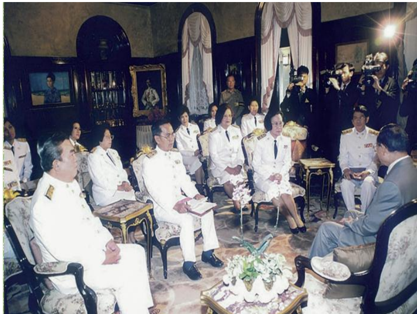
สำมะโนประชากรและเคหะ พ.ศ.๒๕๔๓ คณะผู้บริหารเฝ้าทูลละอองธุลีพระบาทขอพระราชทานสัมภาษณ์ เมื่อวันที่ ๑๙ เมษายน พ.ศ.๒๕๔๓ ณ พระตำหนักเปี่ยมสุข วังไกลกังวล จังหวัดประจวบคีรีขันธ์

พระราชดำรัสพระราชทานแก่คณะผู้บริหารสำนักงานสถิติแห่งชาติ ในโอกาสเข้าเฝ้าทูลละอองธุลีพระบาทเพื่อทูลเกล้าทูลกระหม่อมถวายเอกสารรายงานทางสถิติ และกราบบังคมทูลสัมภาษณ์เกี่ยวกับสำมะโนประชากรและเคหะ พ.ศ. ๒๕๔๓ วันที่ ๑๙ เมษายน ๒๕๔๓ ณ พระตำหนักเปี่ยมสุข วังไกลกังวล หัวหิน จังหวัดประจวบคีรีขันธ์