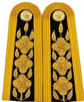
อินทราธนู ข้อชัยพฤกษ์ มีดอก ๓ ดอก