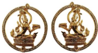
เครื่องหมายแสดงสังกัด กระทรวงดิจิทัลเพื่อเศรษฐกิจและสังคม