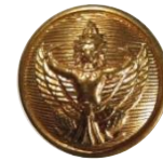
กระดุมครุฑ สีทอง