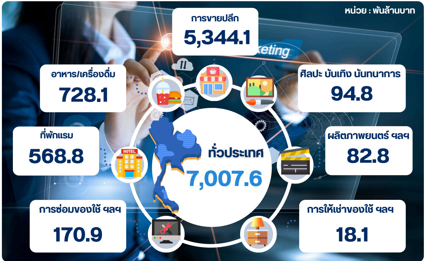
ภาพที่ 2 มูลค่ายอดขาย/รายรับของสถานประกอบการ จำแนกตามประเภทธุรกิจ

เมื่อพิจารณาแต่ละประเภทธุรกิจ พบว่า มูลค่ารายรับส่วนใหญ่มาจากธุรกิจการขายปลีก ประมาณ 5,344.1 พันล้านบาท รองลงมาคือ ธุรกิจการบริการอาหารและเครื่องดื่ม มีมูลค่ารายรับ ประมาณ 728.1 พันล้านบาท ธุรกิจที่พักแรม มีมูลค่ารายรับประมาณ 568.8 พันล้านบาท และธุรกิจการซ่อม ของใช้ส่วนบุคคลและของใช้ในครัวเรือนและกิจกรรมการบริการส่วนบุคคลอื่น ๆ มีมูลค่ารายรับประมาณ 170.9 พันล้านบาท เป็นต้น