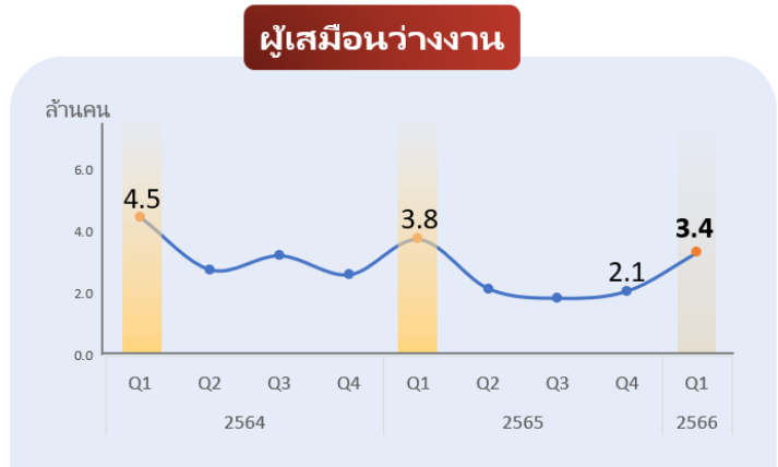
หมายเหตุ : ผู้เสมือนว่างงาน หมายถึง ผู้ที่ทำงาน 0-20 ชม./สัปดาห์ ในภาคเกษตรกรรม หรือผู้ที่ทำงาน 0-24 ชม./สัปดาห์ นอกภาคเกษตรกรรม