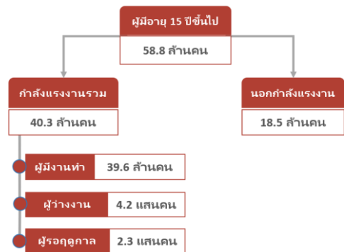
โครงสร้างกำลังแรงงาน ปี 2566 ไตรมาส 1

• การว่างงานลดลง สำหรับสถานการณ์การว่างงานในไตรมาสนี้ ลดลงเหลือ ๔.๒ แสนคน หรือร้อยละ ๑.๑ ซึ่งกลับมาเท่ากับช่วงก่อนการแพร่ระบาดโควิด-๑๙ สำหรับการว่างงานระยะยาว (หรือการว่างงานตั้งแต่ ๑ ปีขึ้นไป) พบว่ามีทิศทางที่ดีขึ้น โดยการว่างงานระยะยาวในไตรมาส ๑ ปี ๒๕๖๖ มีจำนวนลดลงกว่า ๒๖,๐๐๐ คน จากไตรมาสก่อนหน้า (จากเดิม ๑.๑๓ แสนคน เป็น ๘๗,๐๐๐ คน) และกลุ่มคนว่างงานระยะยาวที่จบการศึกษาสูงสุดระดับปริญญาตรี มีจำนวนลดลงอย่างมากในไตรมาสนี้ จาก ๔๕,๐๐๐ คนในไตรมาสที่แล้ว เหลือเพียง ๓๕,๐๐๐ คน